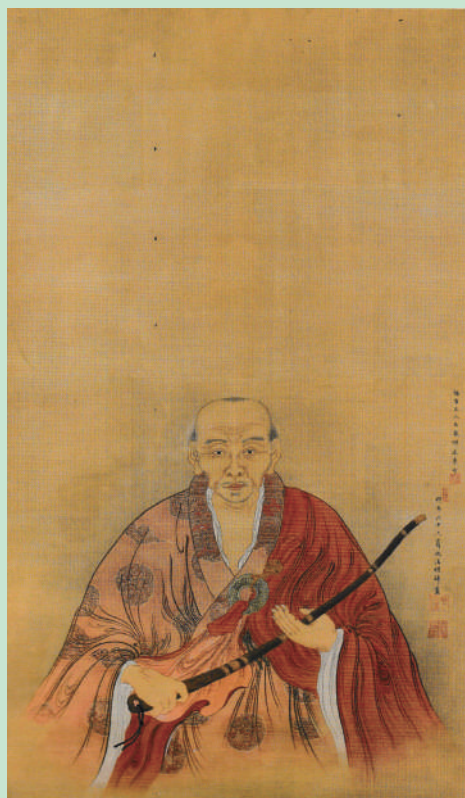
『鉄牛道機像』 兆溪元明筆